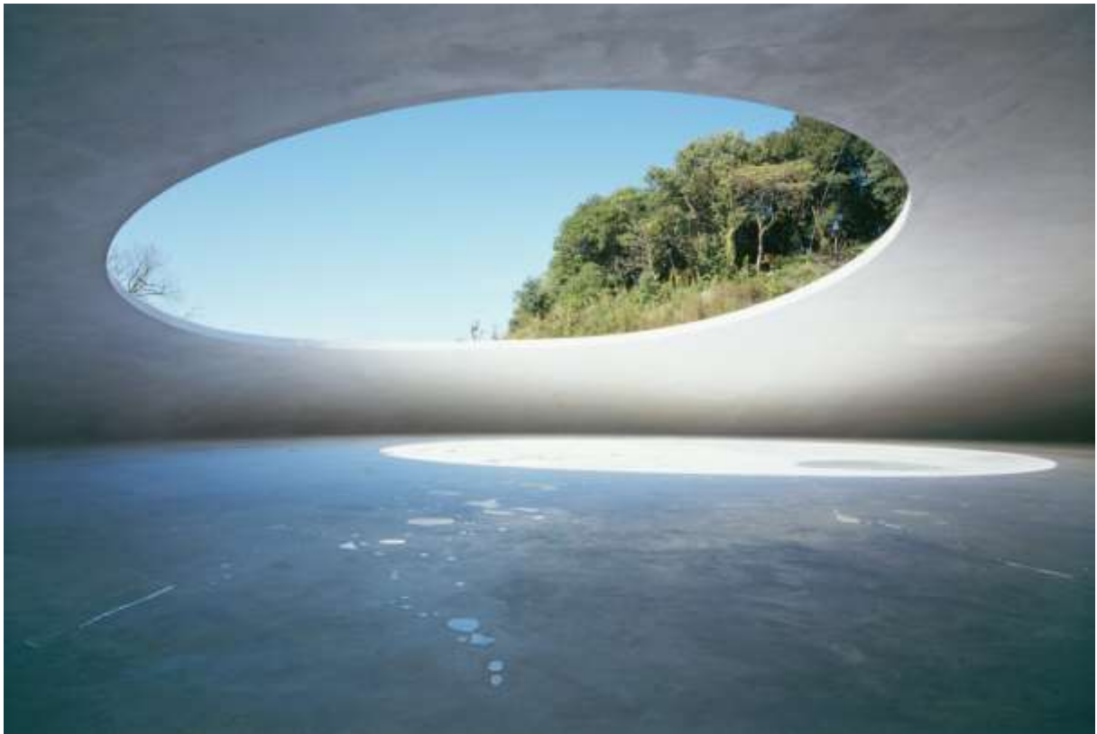
musée d'art contemporain · Teshima

"Je veux que mon architecture inspire les gens à utiliser leurs propres ressources pour aller vers le futur." Tadao Ando